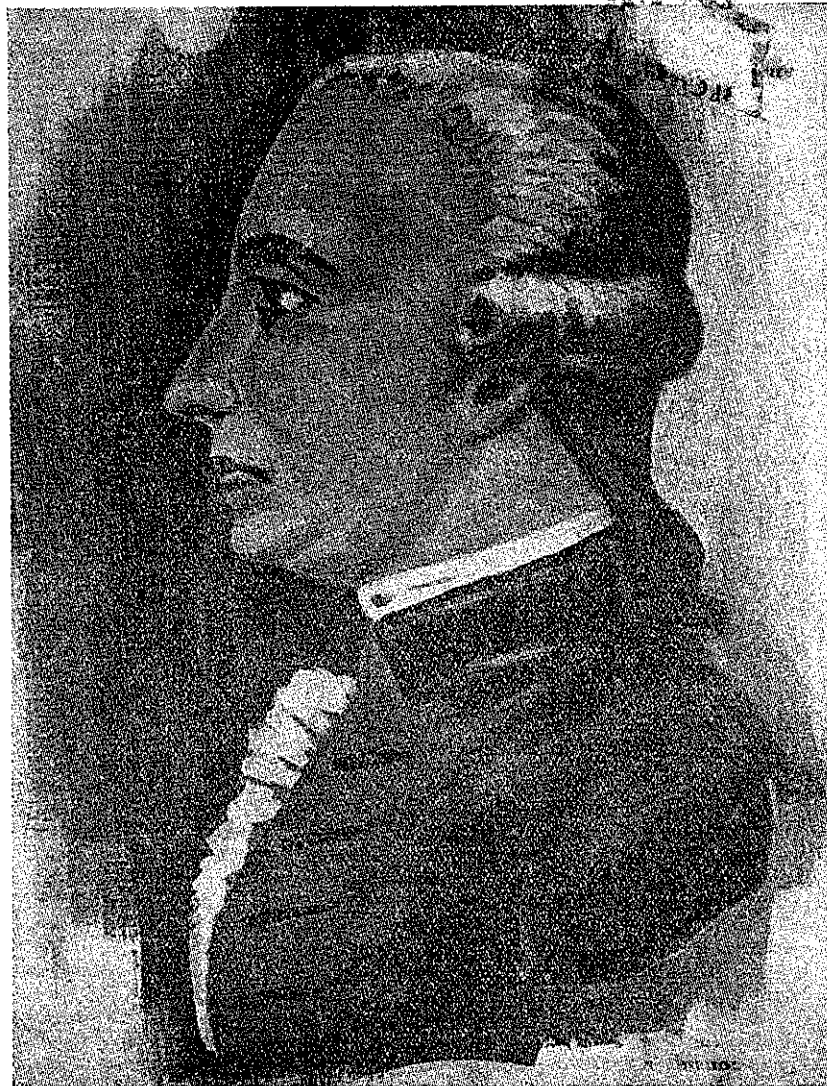
Louis-Claude de SAINT-MARTIN (1743 - 1803)