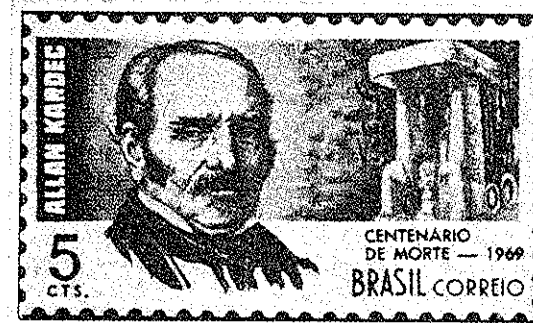
Reproduction du timbre poste émis sous deux couleurs par le ministère des P. T. T. du Brésil pour commémorer le Centenaire du Spiritisme. Les cachets oblitérateurs portent en encadrement Travail - Solidarité - Tolérance. 1 er Centenaire de la désincarnation d'Allan Kardec 31 mars 1969

« Naître, mourir, renaître et progresser sans cesse, telle est la Loi. « C'est cette loi-même qui domine l'existence de chacun de nous. »