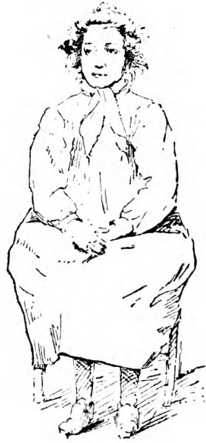
La petite Renée.